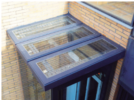
Dach (Blech oder Glas)