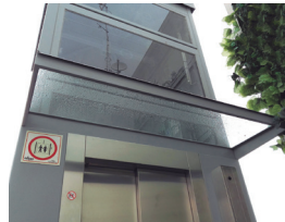
Türüberdachung (Blech oder Glas)