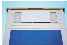
Be- & Entlüftungen