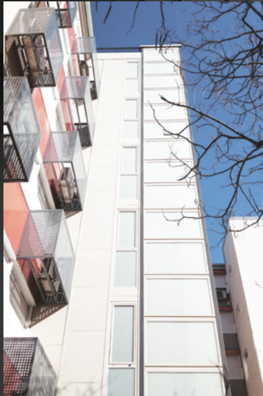
Verre butyral mat