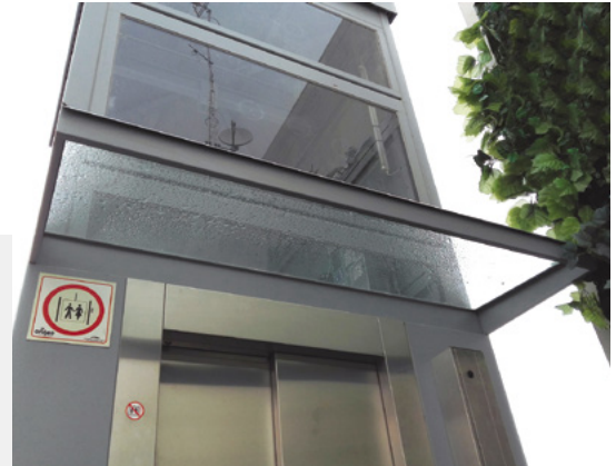
Auvent sur porte (tôle ou verre)