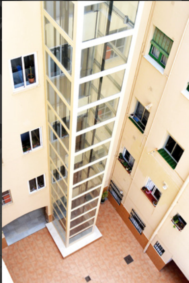
Verre butyral transparent