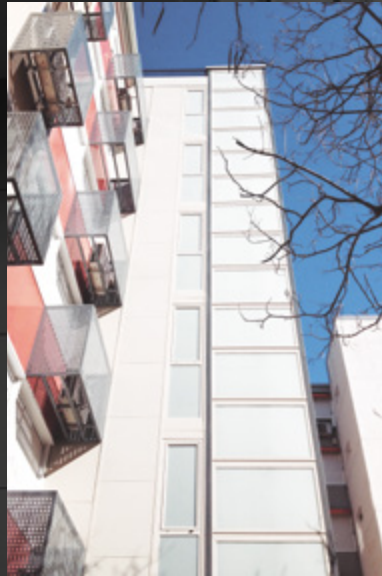
Cristal butiral matizado