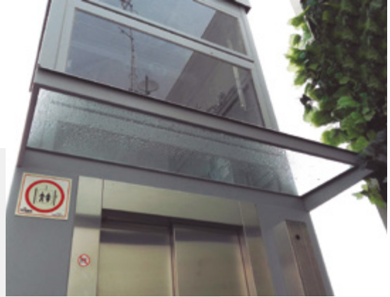
Tejadillo en puerta (chapa o cristal)