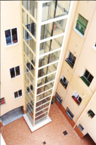
Cristal butiral transparente