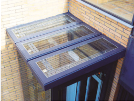
Techo (chapa o cristal)